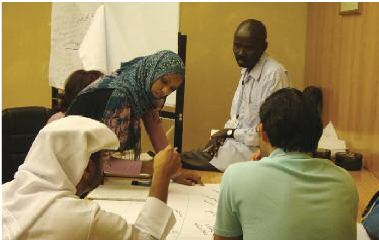
安全培训参加者正在进行行为体分析

在本章，我们看下情境分析之所以有用的若干原因，以及什么时间和谁一起做情境分析。我们采用两大工具来进行情境分析——情境分析问题和行为体情境分析。附录1中也有一个更简单的工具——SWOT（优势，缺点，机会，威胁）分析。