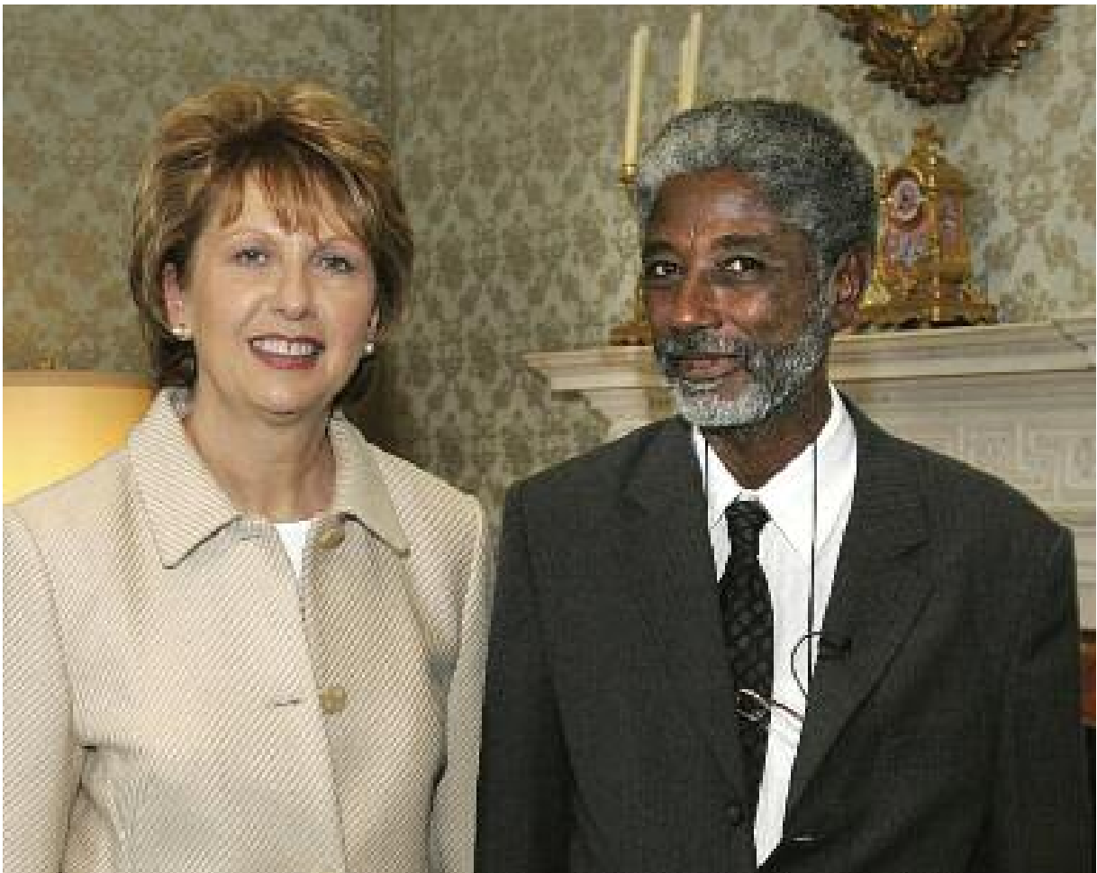
2005 前线组织维权卫士大奖获得者苏丹人姆达维博士与爱尔兰总统玛丽·麦卡利斯女士